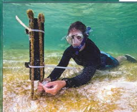
De golfmeters worden met tiewraps vastgezet (links). Met zo veel schildpadden in de buurt, is het niet vreemd dat de dieren hun eieren op Derawan leggen. Het vrouwtje graaft een kuil op het strand waar ze de eieren in laat vallen. Niet vergeten om het gat weer dicht te gooien, anders hebben rovers een feestmaal aan de eieren. Als de eieren uitkomen, is mama al lang weg. De jongen moeten zich uitgraven en zelf de zee zien te bereiken.