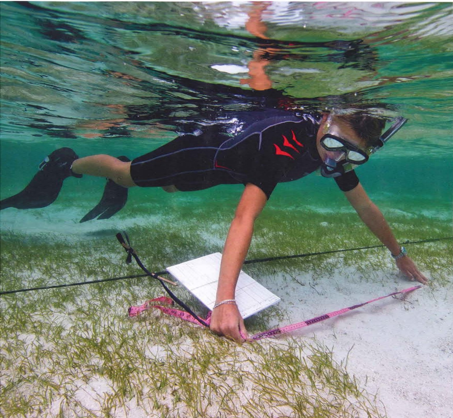
Weer een zee gras gat in kaart gebracht.