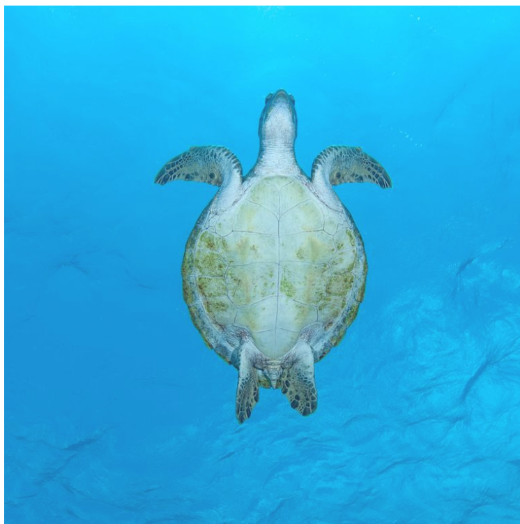
Een zeeschildpad in de wateren rond Bonaire.

Een toename van het aantal toeristen verhoogt de kans op contact tussen mens en zeedier. Een collega uit Sint Maarten toonde zeer verontrustende beelden van gebarsten schilden na aanvaringen met motorboten. Op sommige eilanden worden zeeschildpadden gevoederd, waardoor de relaxte stoners zoals in de film Finding Nemo veranderen in opdringerige bijters .